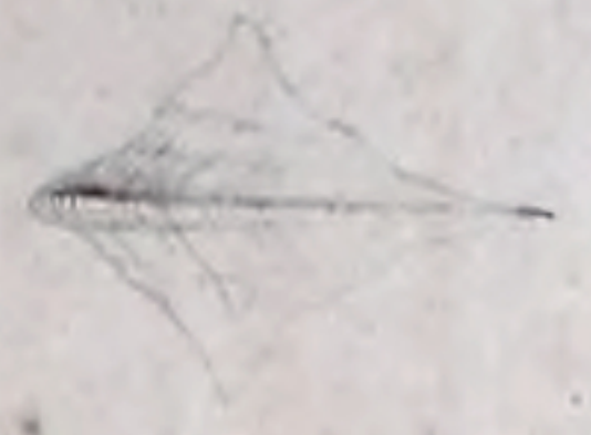
F. 4. B.