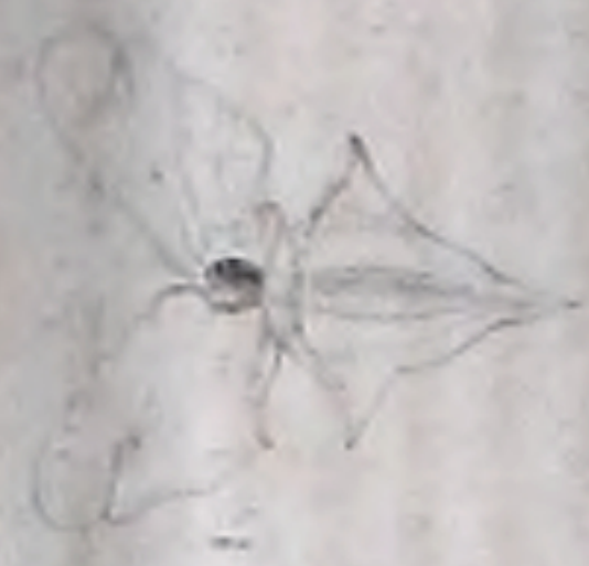
F. 3. C.